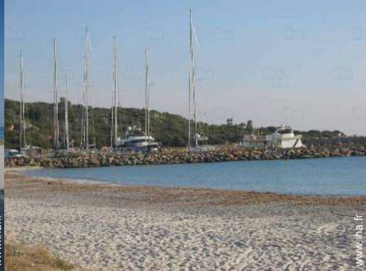
vue sur port