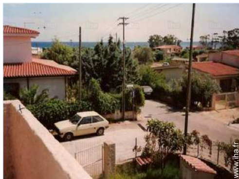
vue de la propriété