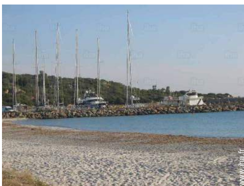
vue sur port