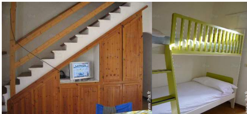
Agencement intérieur et commodités