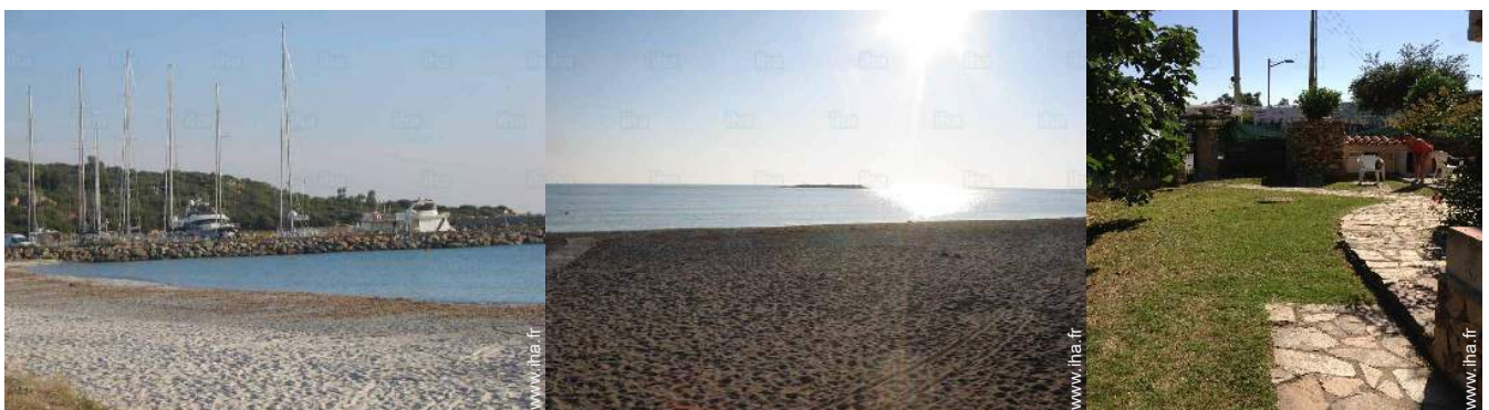
vue sur port