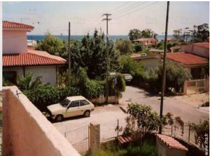
vue de la propriété