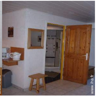
salle(s) de douche