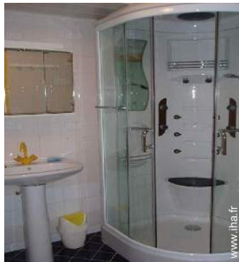
salle(s) de douche