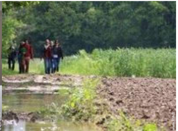
loisirs à proximité