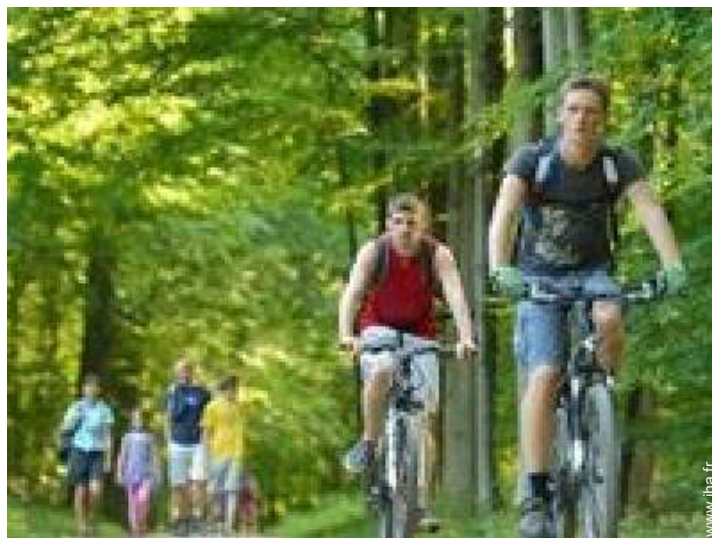
loisirs à proximité