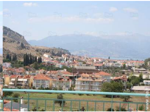
vue sur mer