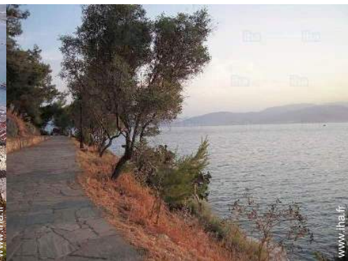
chemin de promenade