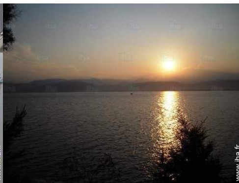
vue sur coucher de soleil