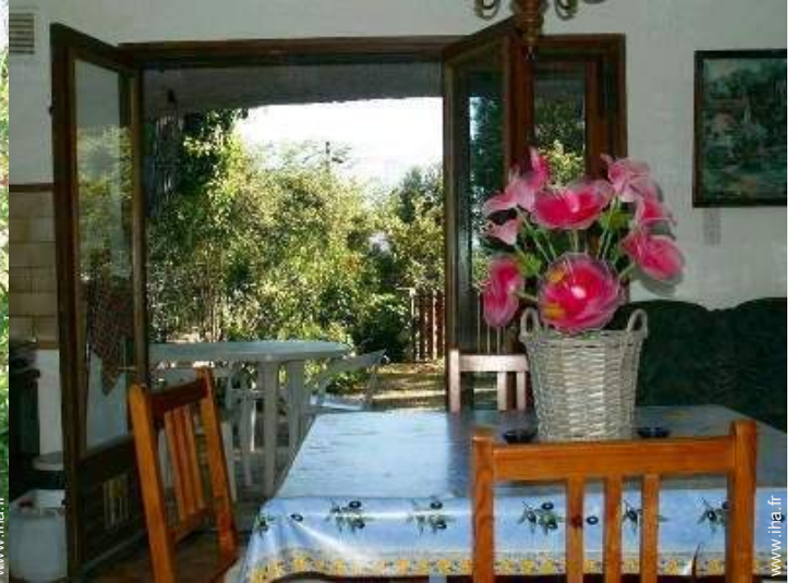
vue sur jardin/parc