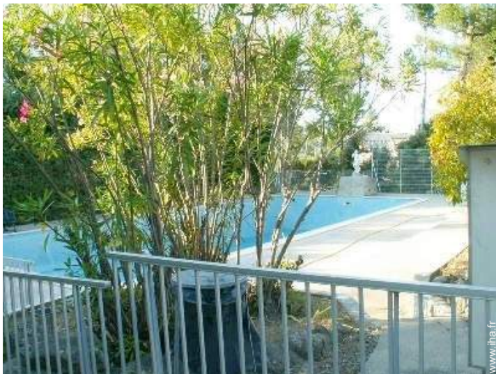
piscine dans la résidence