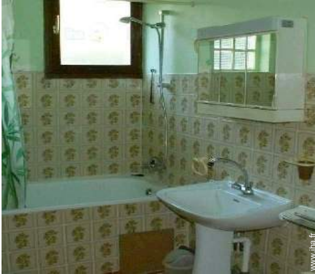
salle(s) de bain