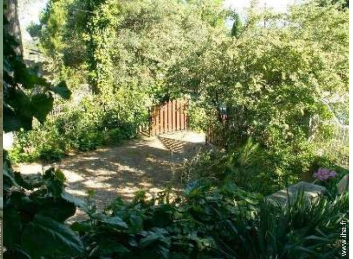
vue depuis le jardin/parc