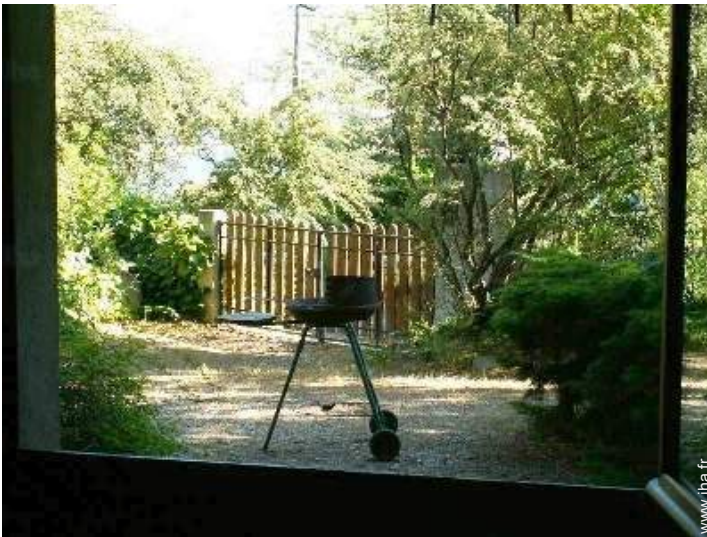
vue depuis l'appartement