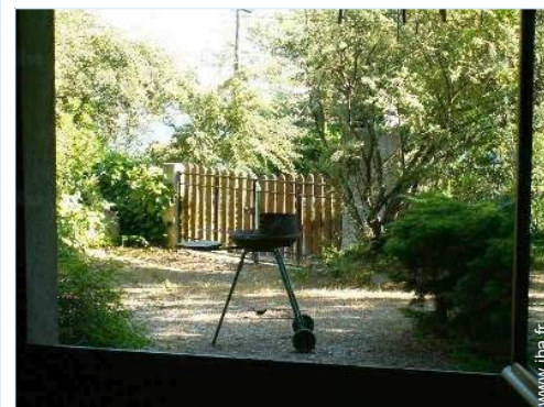
vue depuis l'appartement