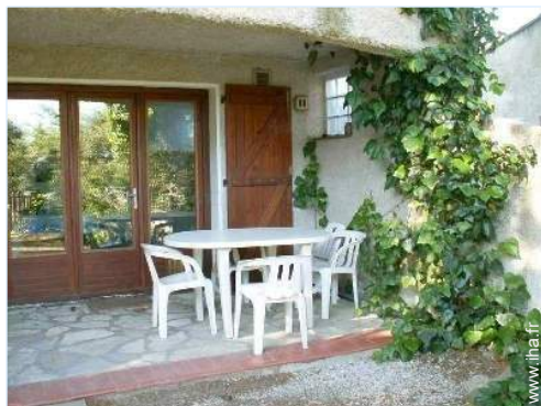
vue sur cour