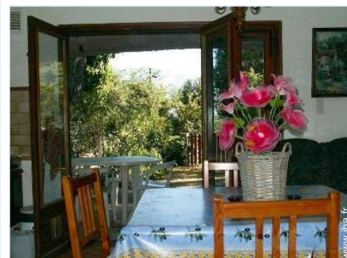
vue sur jardin/parc