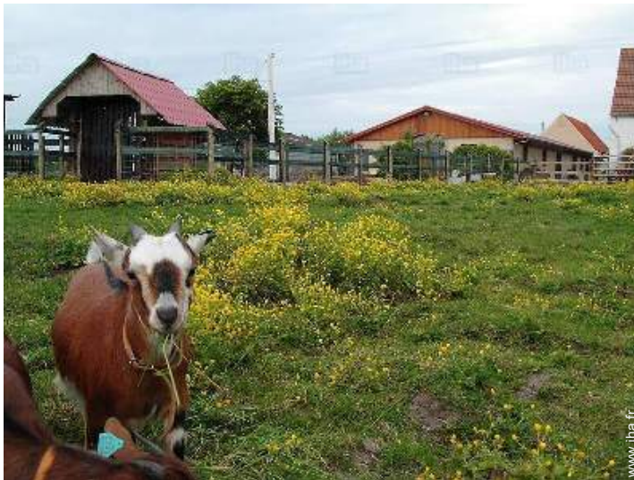
animaux de ferme