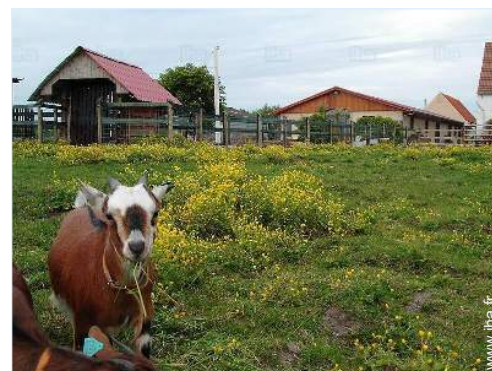
animaux de ferme