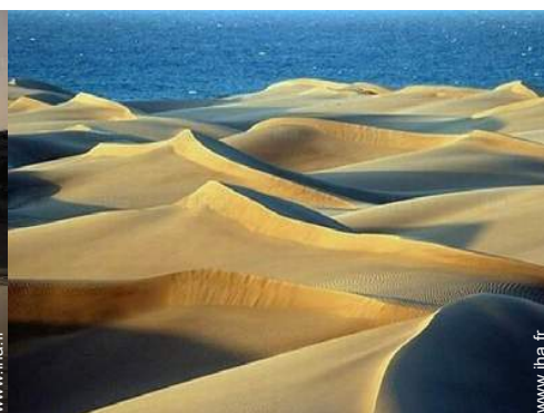
plage de naturisme