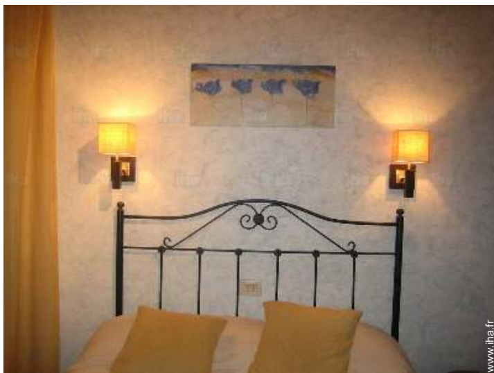
Couchage - lit(s)