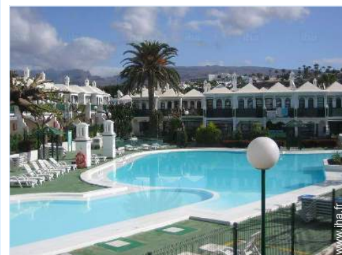
vue depuis le balcon