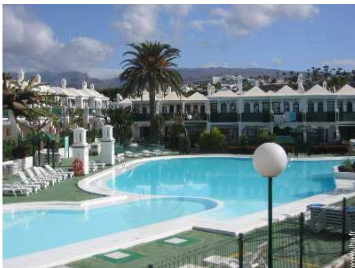
vue depuis le balcon