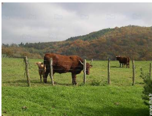
vue sur campagne