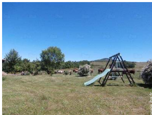
aménagement de loisirs