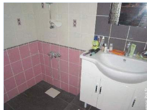
salle(s) de douche