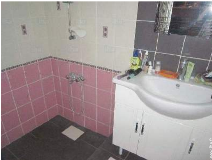
salle(s) de douche