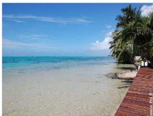
vue sur mer