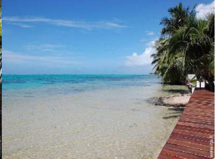
vue sur mer