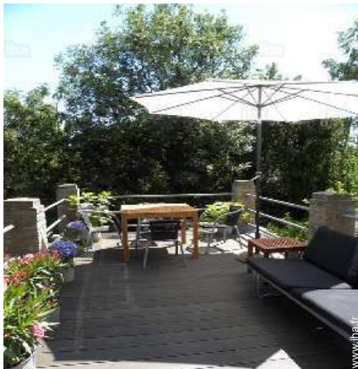
terrasse sur toit