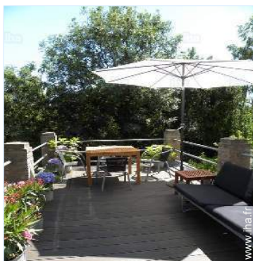
terrasse sur toit