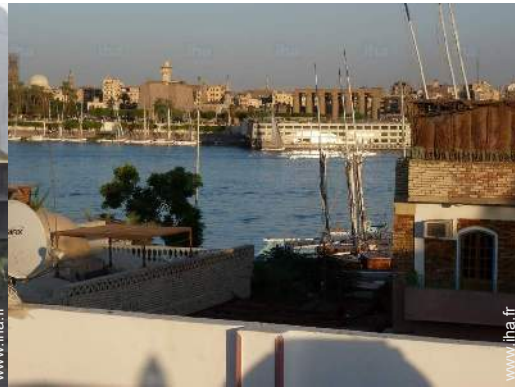
vue depuis la terrasse sur toit