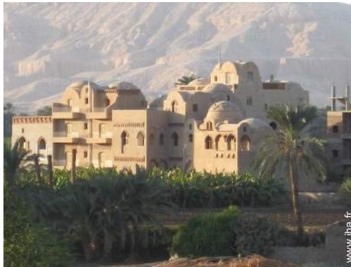
vue depuis la terrasse sur toit