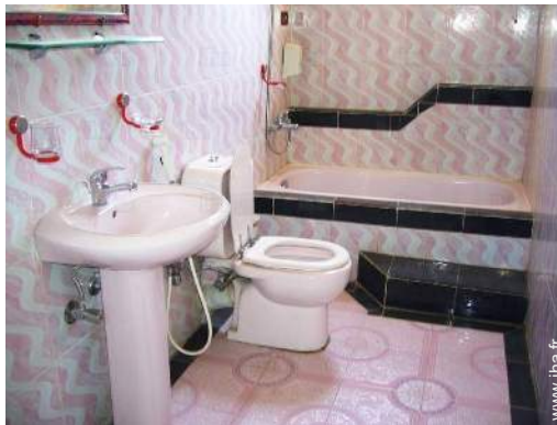
salle(s) de bain