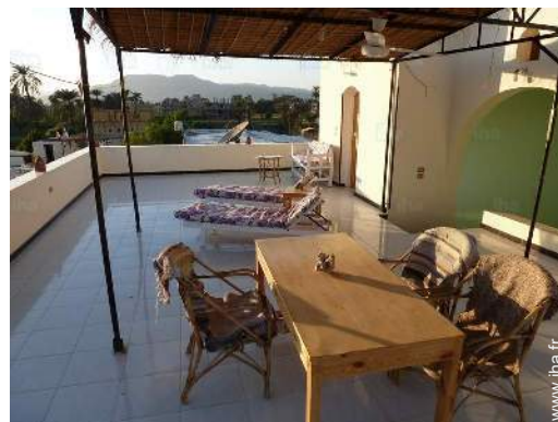
terrasse sur toit