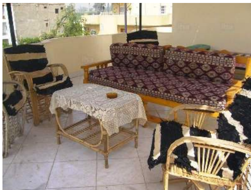
terrasse sur toit