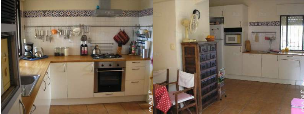
grande cuisine indépendante