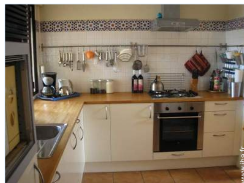
grande cuisine indépendante