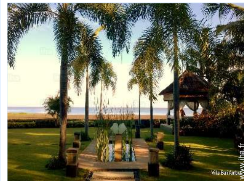
vue sur mer

Mer/océan <50m Plage de sable <50m Court de tennis public 10km Parcours de golf 18 trous 40km Rapides sur rivières >50km Massif montagneux 2km