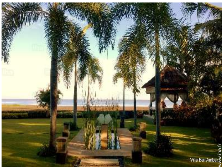
vue sur mer