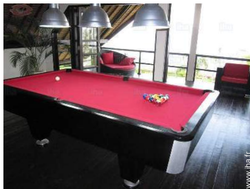
table de billard