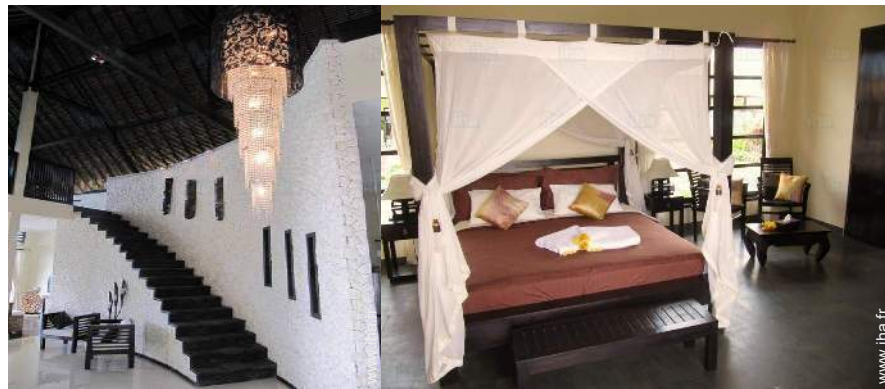
lit(s) double(s) à baldaquin