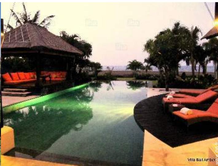
vue sur piscine