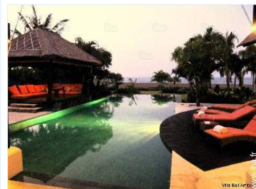
vue sur piscine