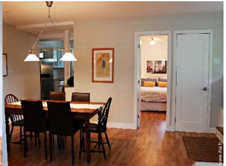
salle à manger