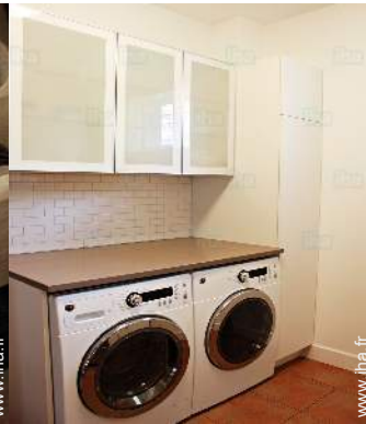
Equipements à disposition