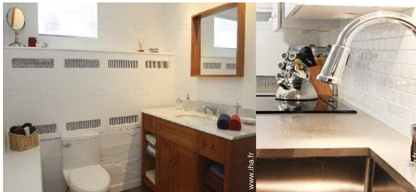
salle(s) de bain