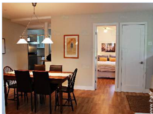
salle à manger