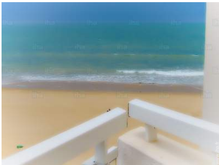
vue depuis l'appartement