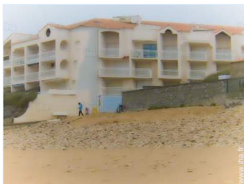
vue sur mer