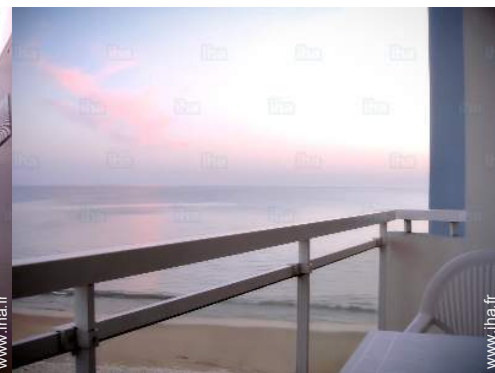
vue sur coucher de soleil