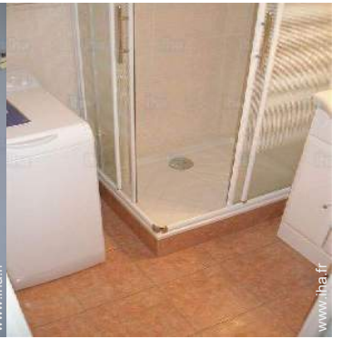
salle(s) de bain