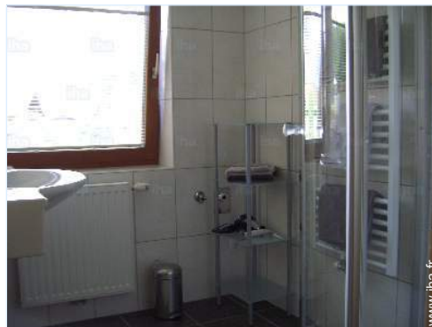
salle(s) de douche