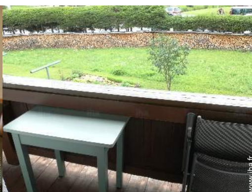
vue depuis le séjour