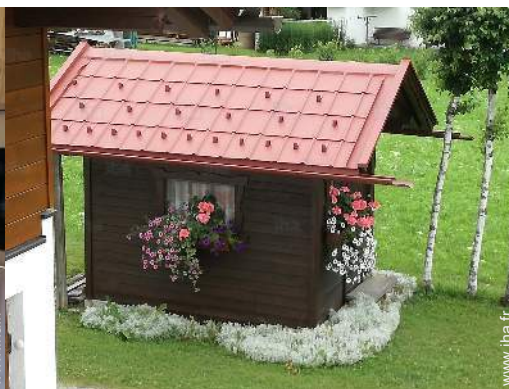
vue depuis la chambre