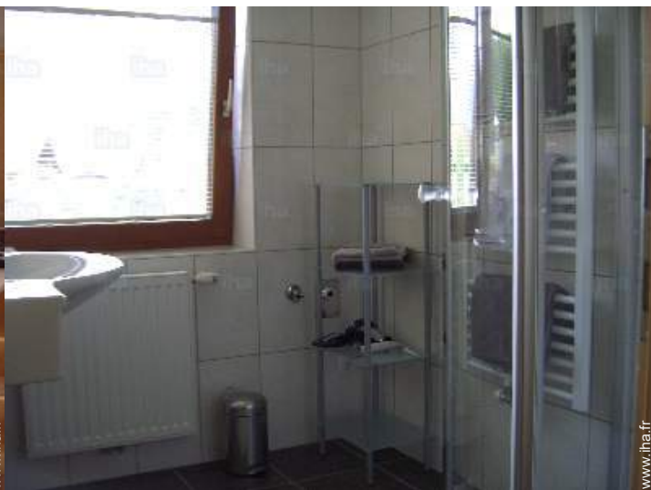
salle(s) de douche