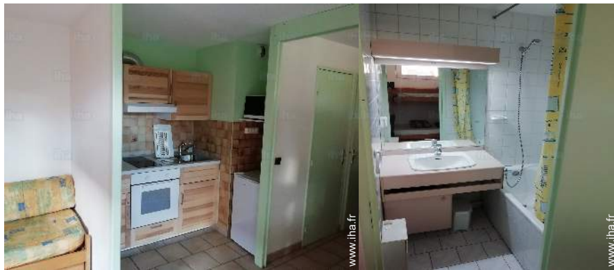
★ Emplacement de l'appartement au Lautaret