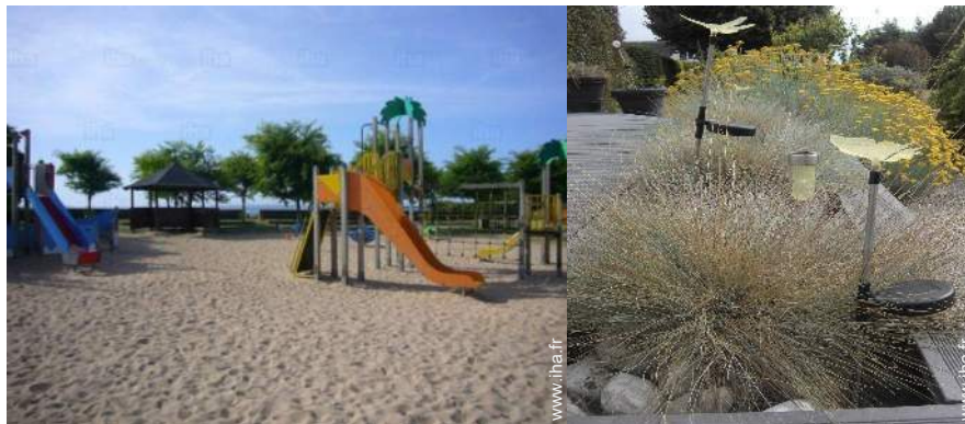
aménagement de loisirs