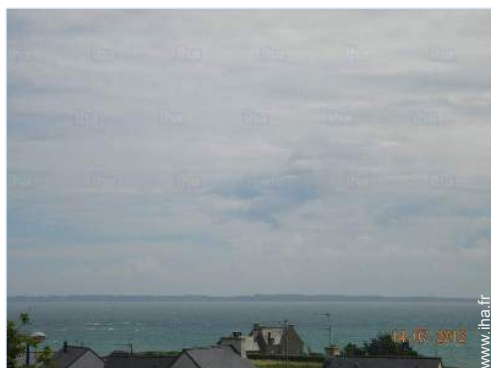
vue depuis la maison