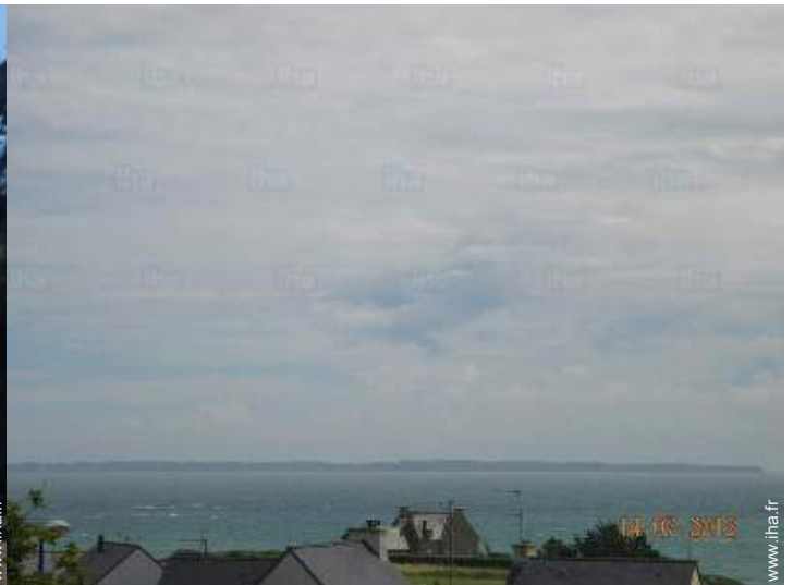
vue depuis la maison