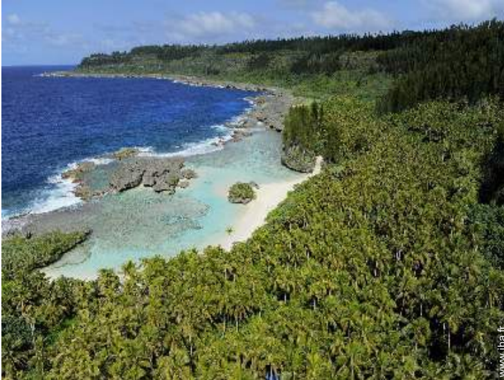
plage de sable