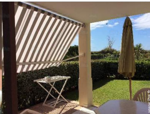
vue depuis la terrasse couverte