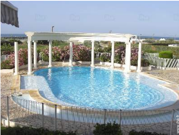
piscine dans la résidence