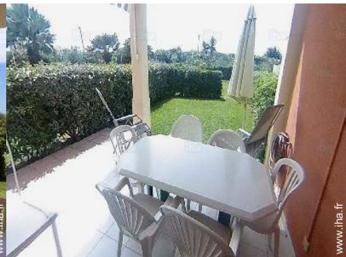
vue depuis la terrasse couverte