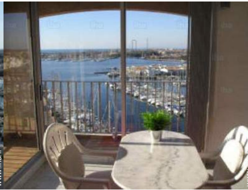
vue sur port