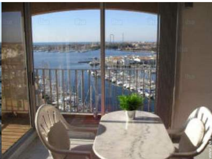
vue sur port