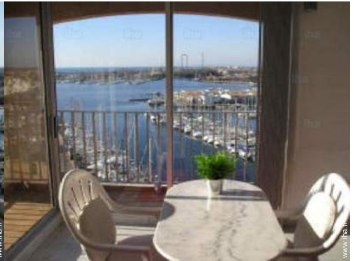
vue sur port