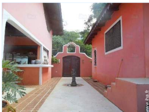
vue depuis la piscine