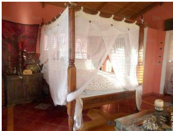
chambre du propriétaire