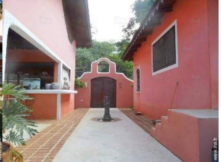
vue depuis la piscine