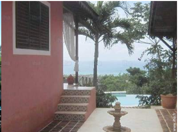
vue depuis la maison