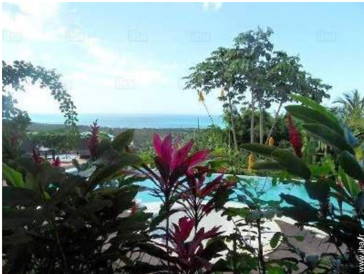
vue depuis la maison