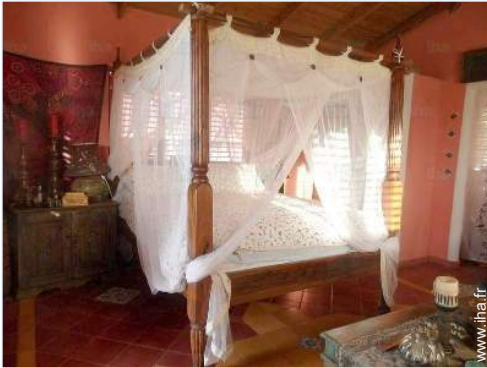
chambre du propriétaire