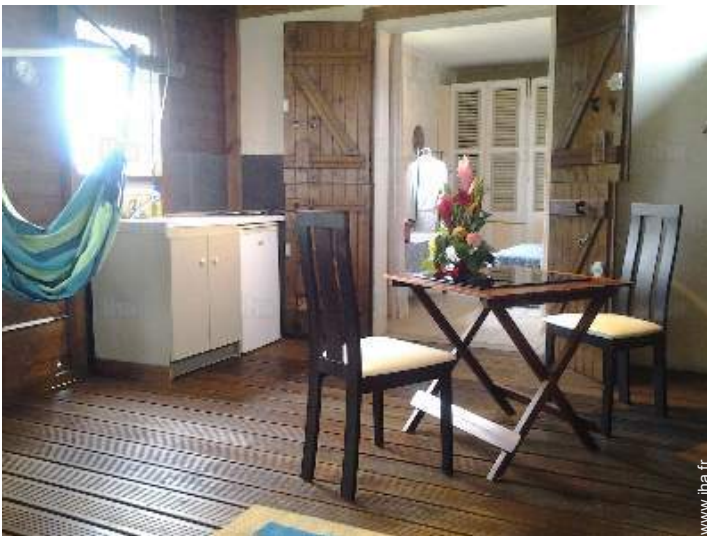
possibilité couchage(s) supplémentaire(s)