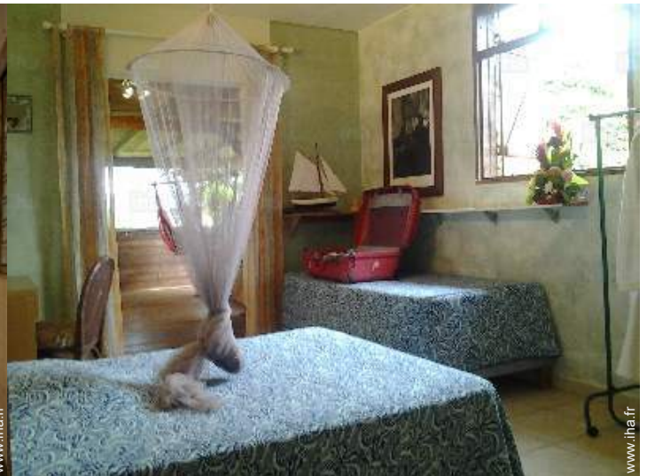
possibilité couchage(s) supplémentaire(s)