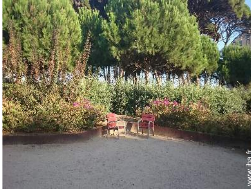
parc et jardin