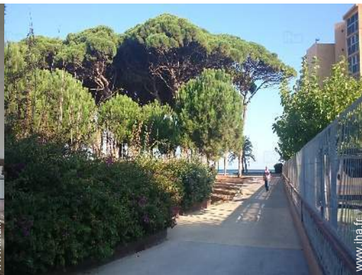
vue sur rue piétonne