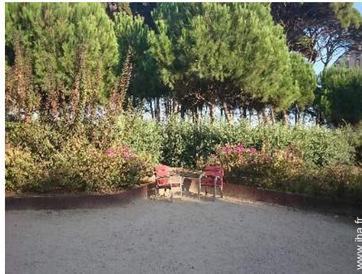
parc et jardin