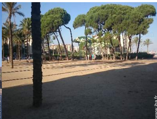
loisirs à proximité