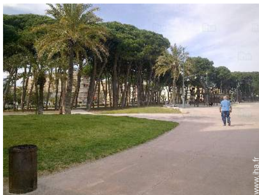
vue sur rue piétonne