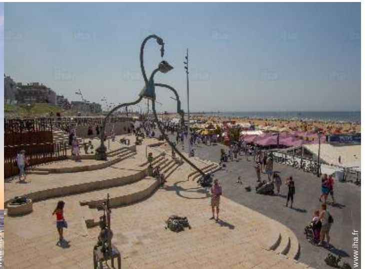
accès direct plage