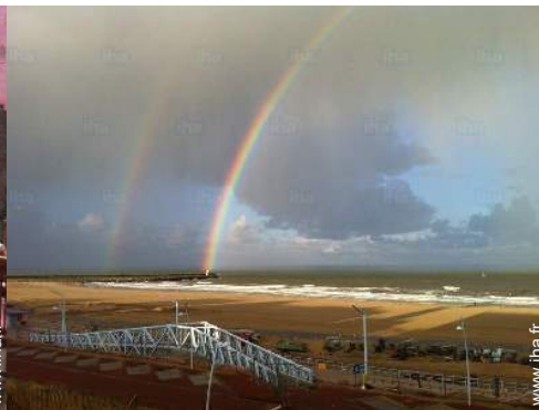
vue sur mer