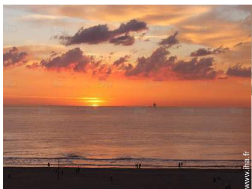
vue sur coucher de soleil