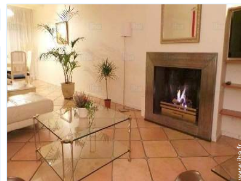
coin du feu