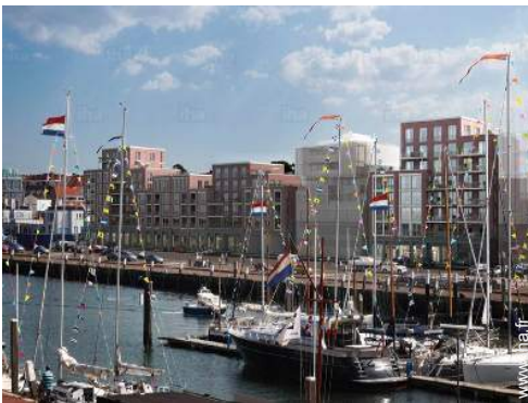
port de plaisance