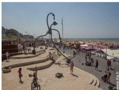
accès direct plage