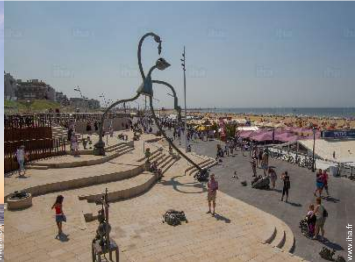
accès direct plage