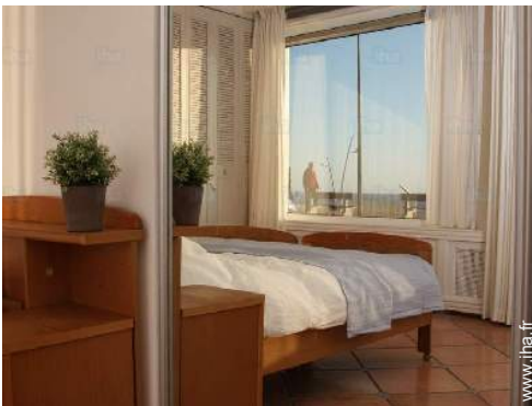
vue depuis la chambre