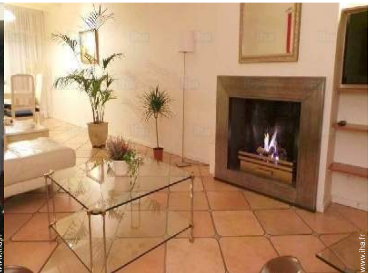
coin du feu