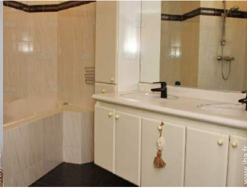
salle(s) de bain