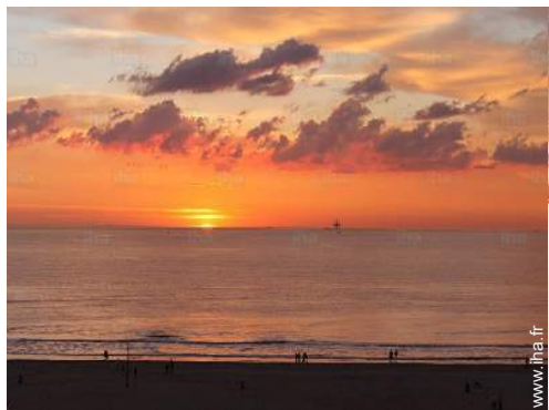
vue sur coucher de soleil