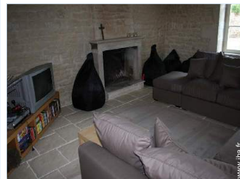
coin du feu