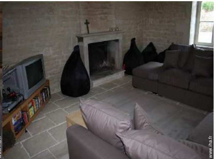
coin du feu