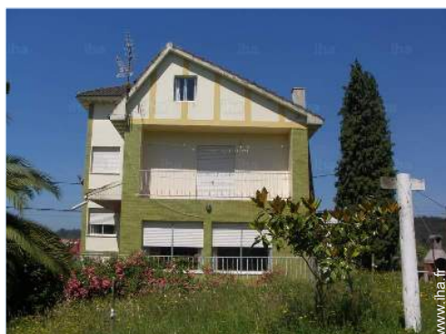
Maison de Campagne