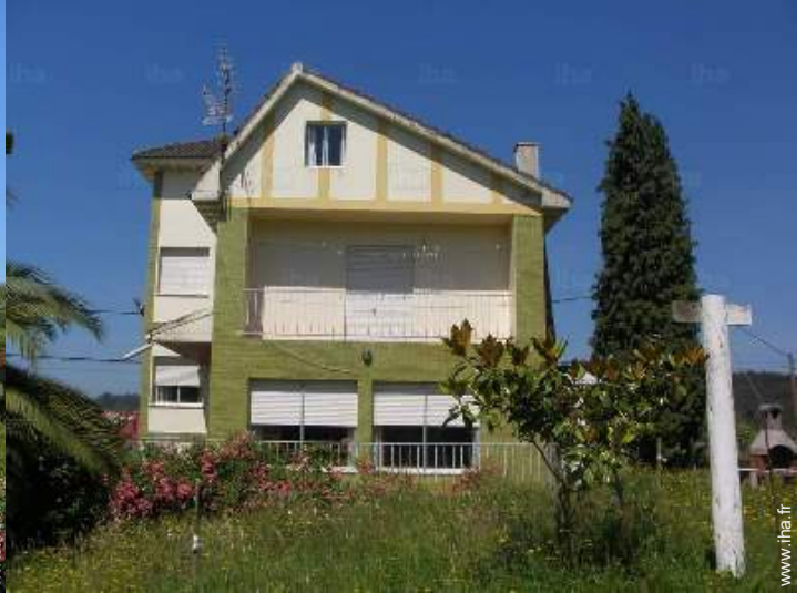
Maison de Campagne