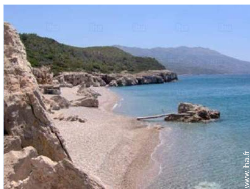
plage de sable