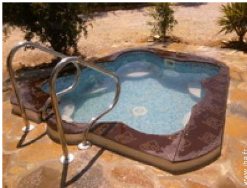
Equipements de loisir