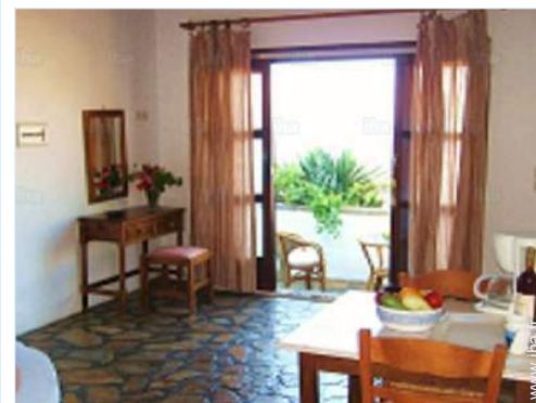
Agencement intérieur et commodités

Centre village 800m Centre ville 2,5km Location de vélo/VTT 2km Location de moto/scooter 2km Location de voiture 2km Boulangerie 800m Traiteur 1,5km Petits commerces 800m Super marché 2km Salon de coiffure <50m Cyber café 2km Poste 2,5km Banque 2,5km Distributeur automatique de billets 2km Pharmacie 2,5km Médecin 2,5km Hôpital 15km Dispensaire 2,5km