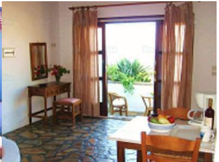
Agencement intérieur et commodités