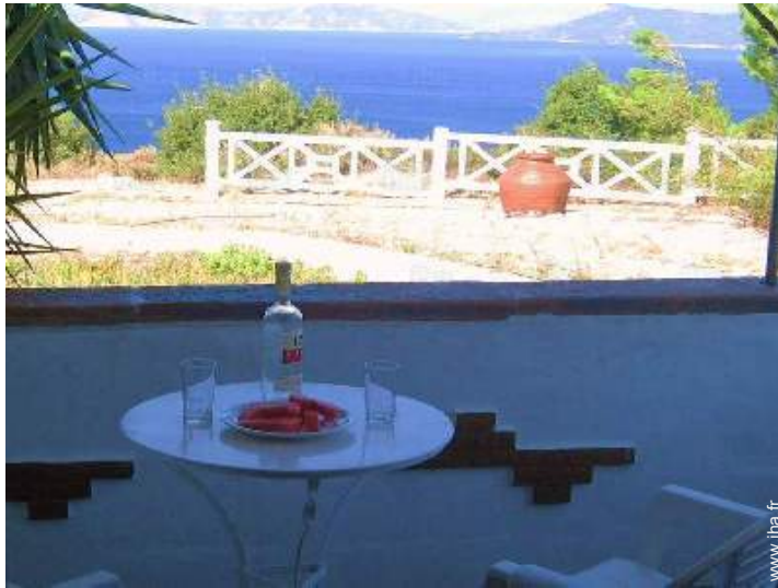
vue depuis la véranda