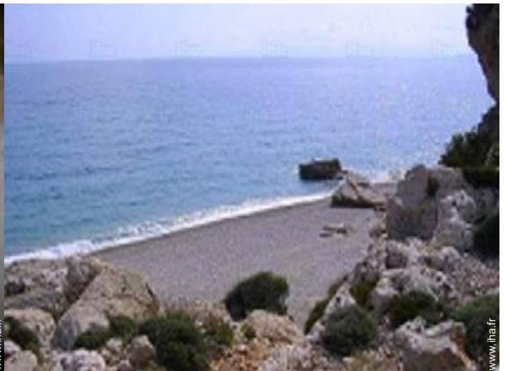
plage de sable