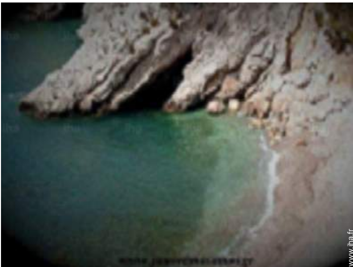
plage de sable