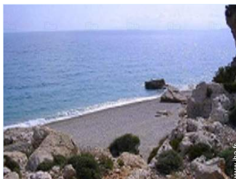
plage de sable