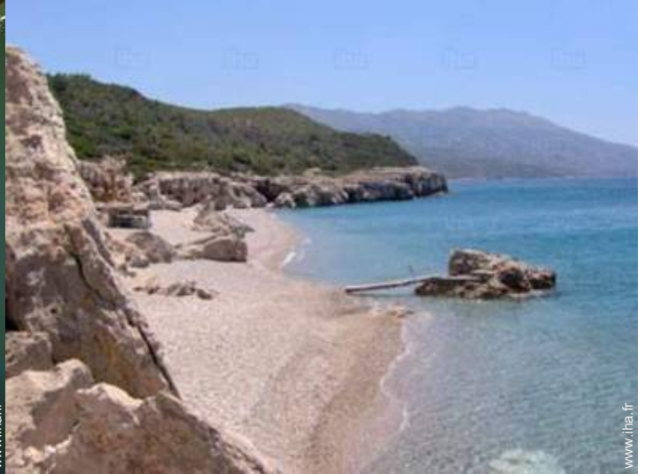
plage de sable