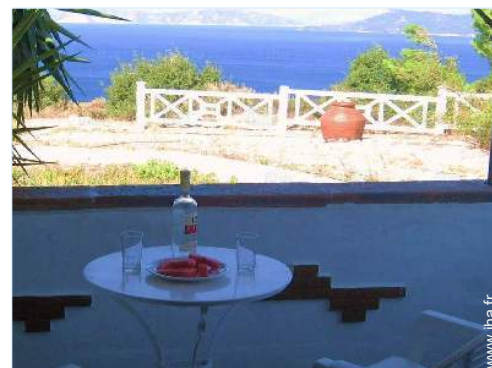
vue depuis la véranda