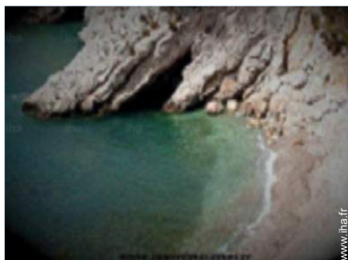
plage de sable