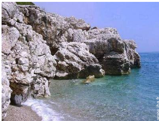
plage de rocher