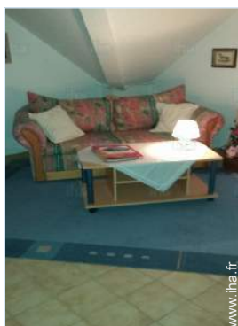
vue depuis le séjour