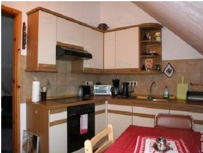
vue depuis la cuisine