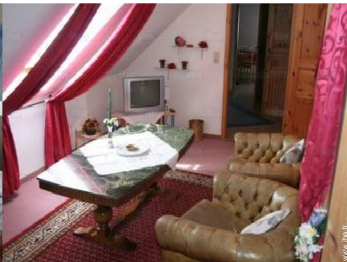
vue depuis le salon