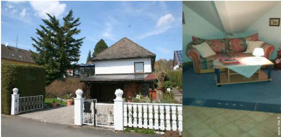
vue depuis le séjour