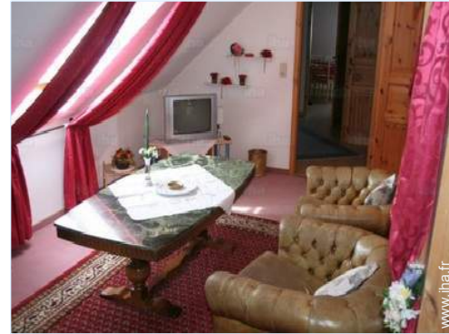
vue depuis le salon

Salon d'été, barbecue, table(s) de jardin, 6 chaise(s) de jardin, tonnelle, parasol, salon de jardin, 4 transat(s), 2 rocking chair(s)