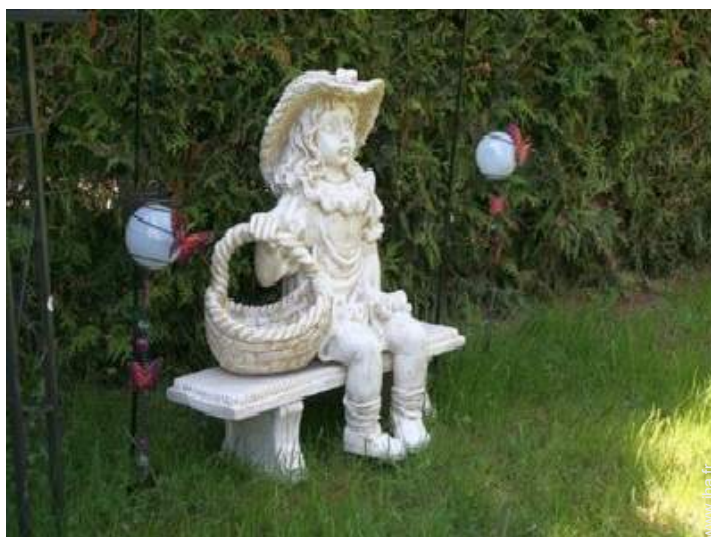
vue sur jardin/parc