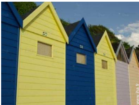
école de voile