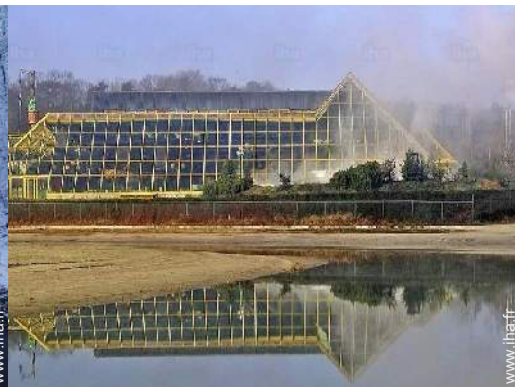
loisirs balnéaires à proximité