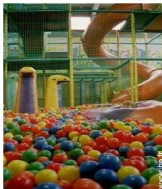
aménagement de loisirs