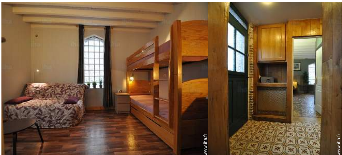
Couchage - lit(s)