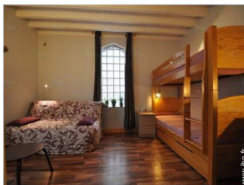
Couchage - lit(s)