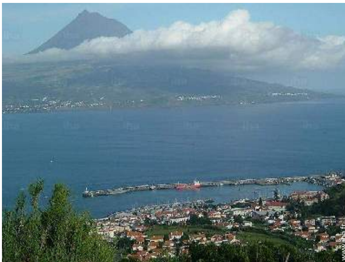
vue sur ville