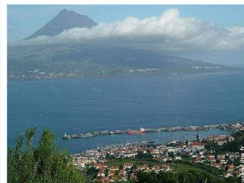
vue sur ville