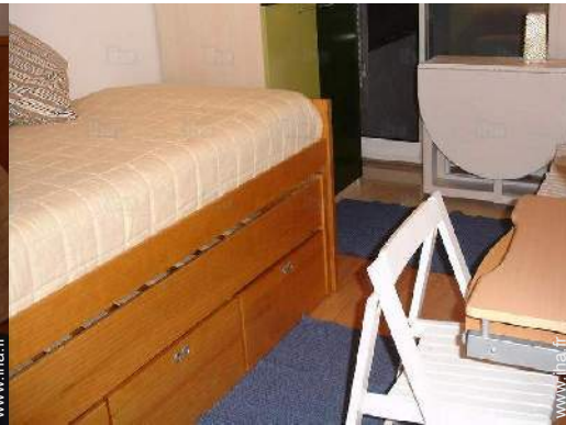
lit(s) escamotable(s) 2 pers