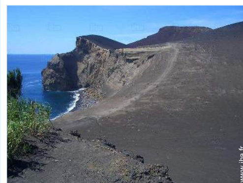
Attrait et détente

Mer/océan 50m Plage de sable 50m Spot de windsurf 500m Port de plaisance 500m