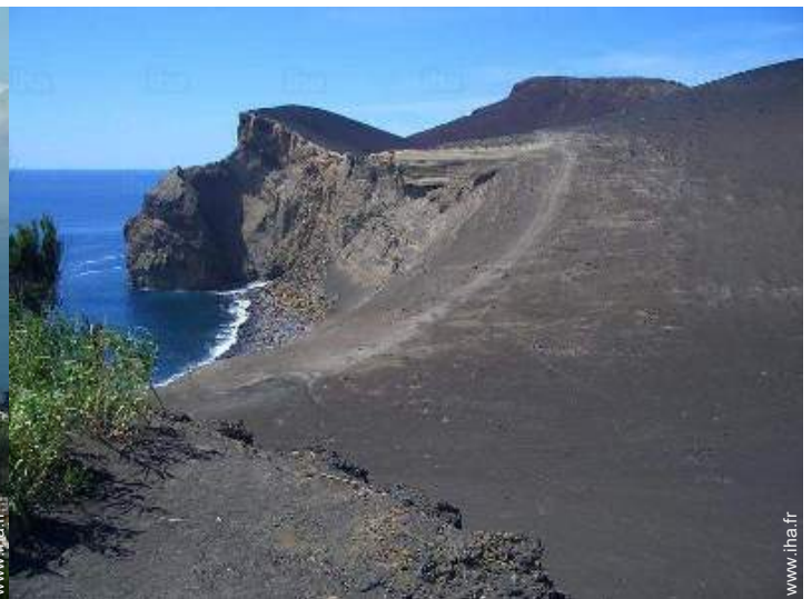
Attrait et détente