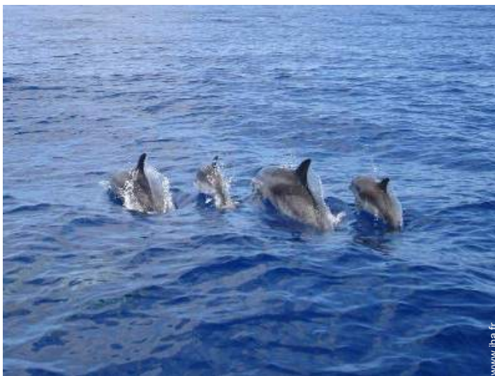
excursion en bateau