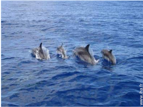
excursion en bateau