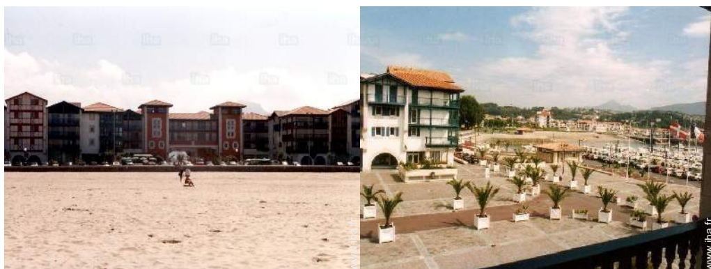
plage de sable