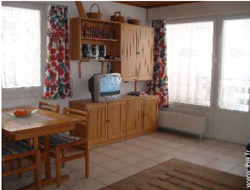
vue depuis le séjour