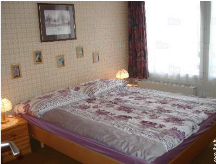
vue depuis la chambre