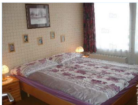
vue depuis la chambre