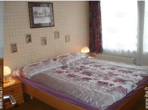
vue depuis la chambre