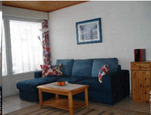
vue depuis le séjour