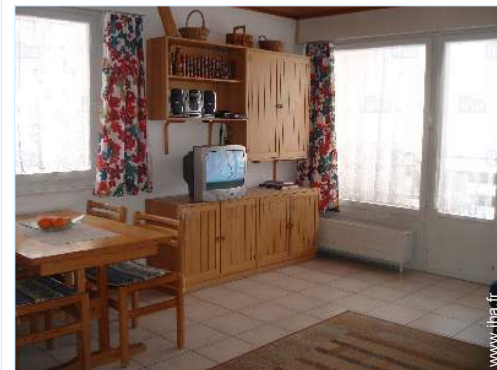
vue depuis le séjour

Salon de coiffure 300m Cyber café 300m Poste 300m Banque 300m Distributeur automatique de billets 300m Pharmacie 300m Médecin 500m Hôpital 15km Dispensaire 500m