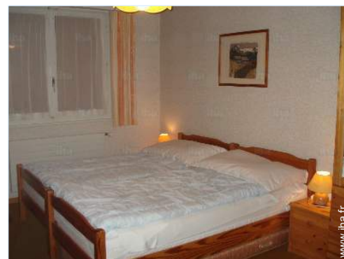
vue depuis la chambre