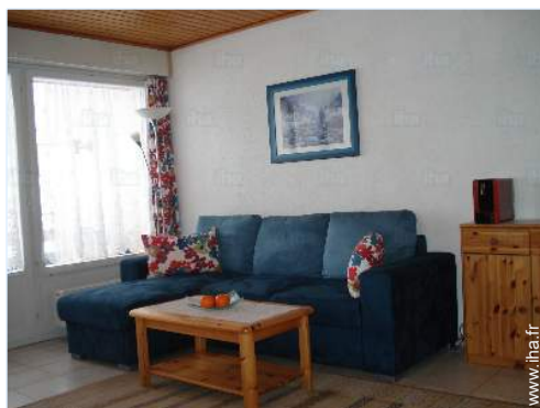
vue depuis le séjour