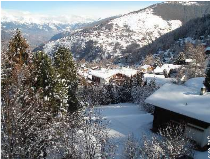
vue depuis l'appartement