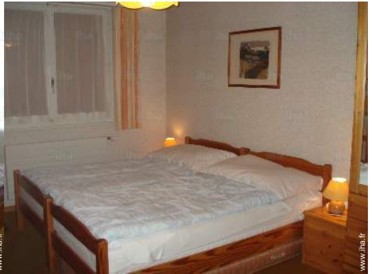
vue depuis la chambre