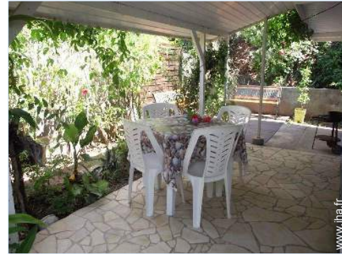
vue depuis la terrasse couverte