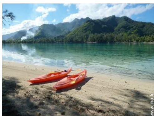
bateau avec rames