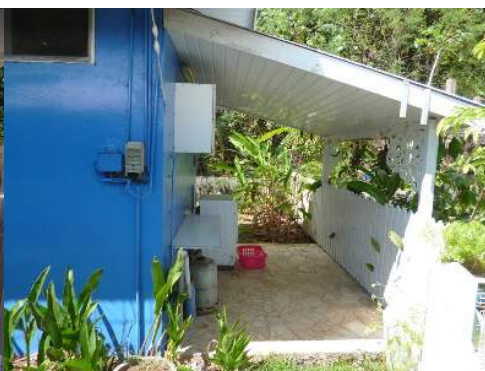
Equipements à disposition