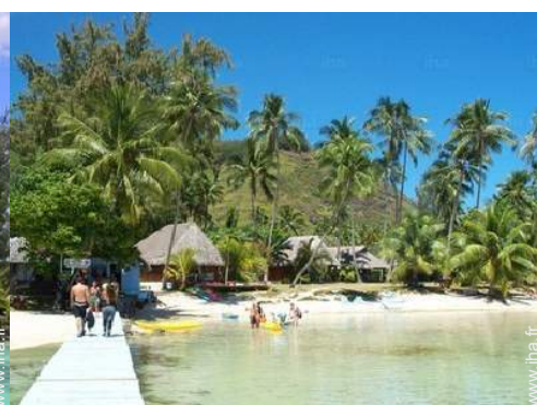
loisirs balnéaires à proximité