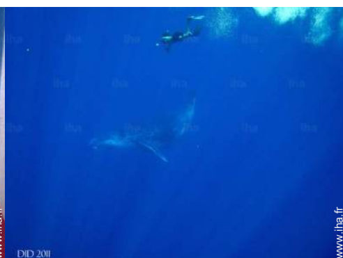
loisirs balnéaires à proximité