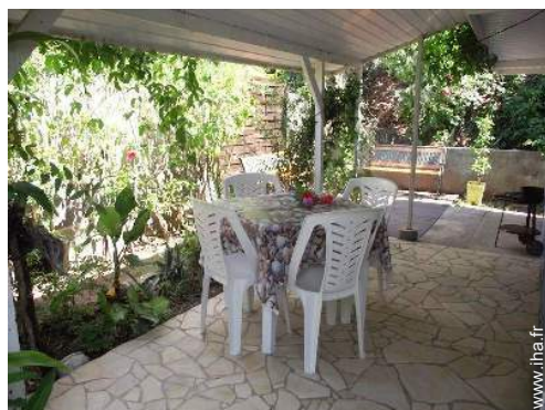
vue depuis la terrasse couverte