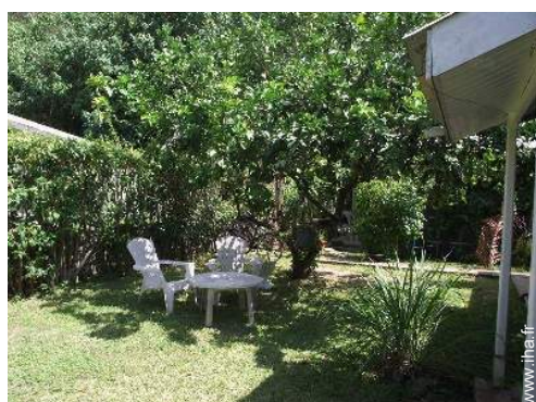
vue depuis le jardin/parc