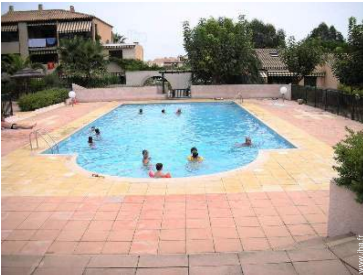
piscine dans la résidence