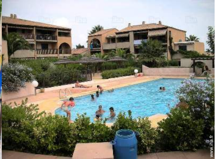
piscine dans la résidence