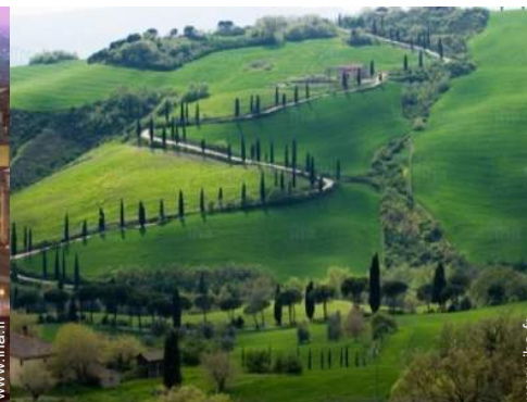
Attraites et détente