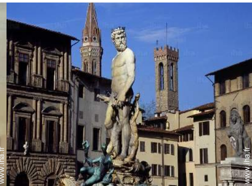
vue sur monument