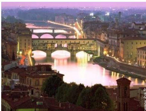
vue sur ville