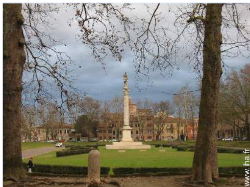
vue de la propriété