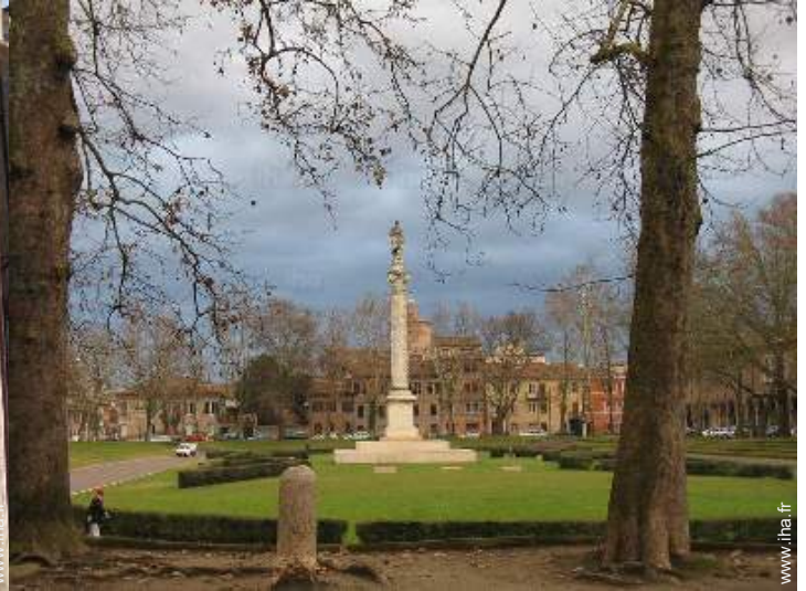
vue de la propriété