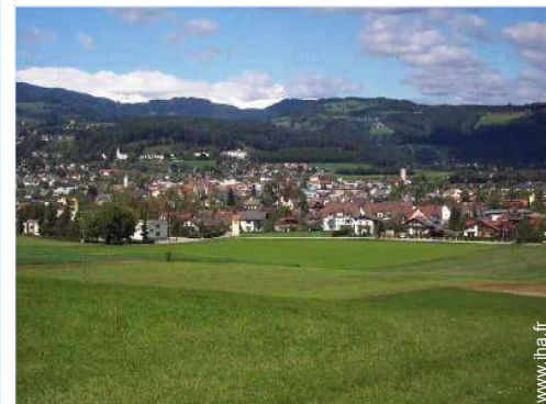
vue sur campagne