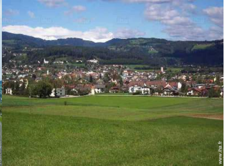
vue sur campagne