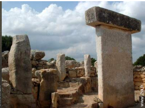
Attraites et détente