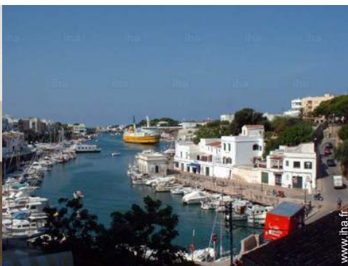
Villes à proximité