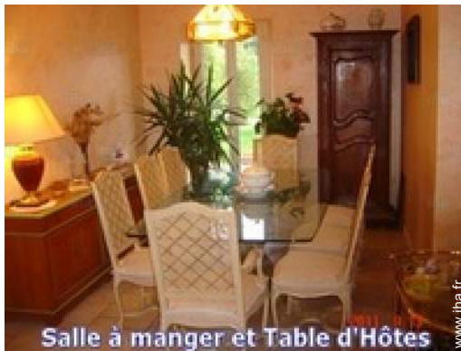
Salle à manger et Table d'Hôtes