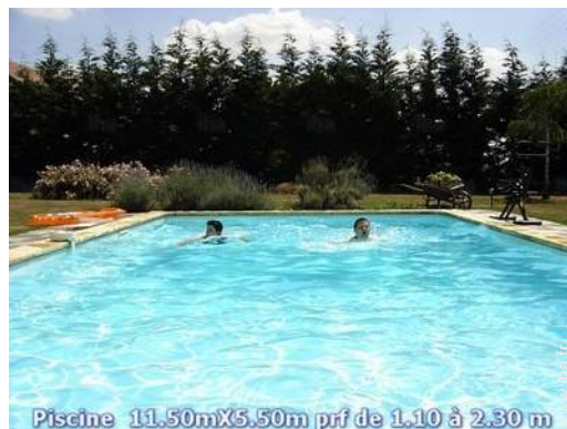
Piscine 11.50mX5.50m prf de 1.10 à 2.30 m