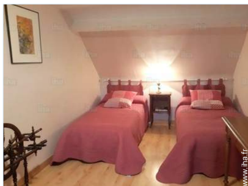
lits jumeaux simple