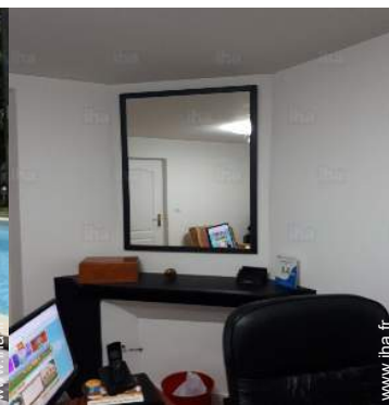
vue depuis le bureau