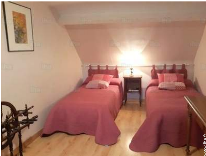
lits jumeaux simple