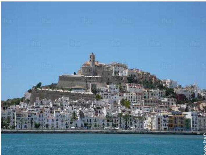
vue sur ville