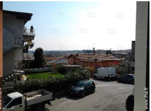
vue depuis la maison