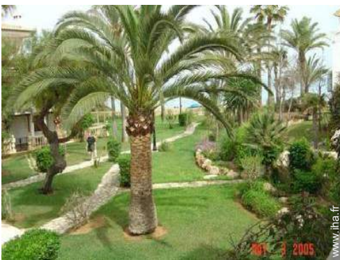
Résidence de standing