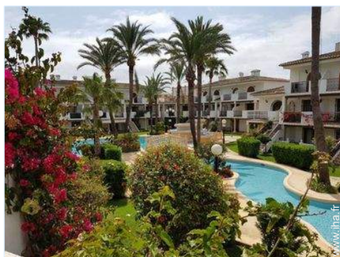
Résidence de standing