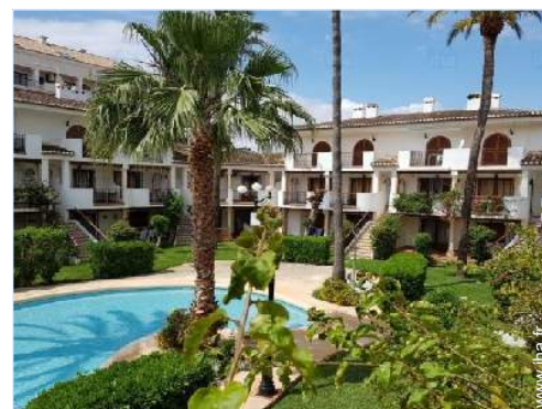
Résidence de standing