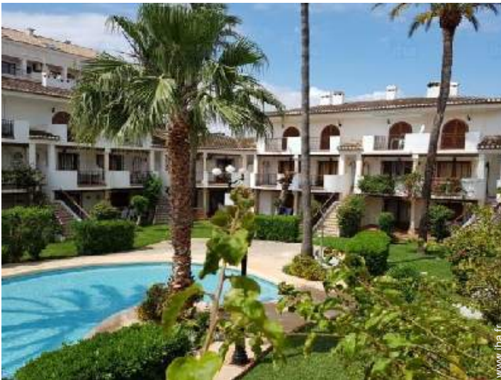
Résidence de standing