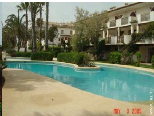
Résidence de standing