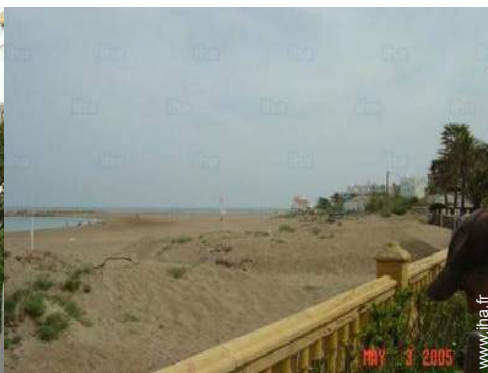
plage de sable