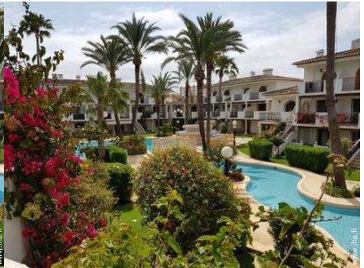
Résidence de standing