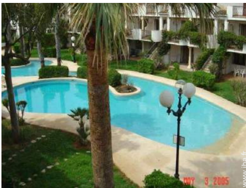
vue depuis le balcon