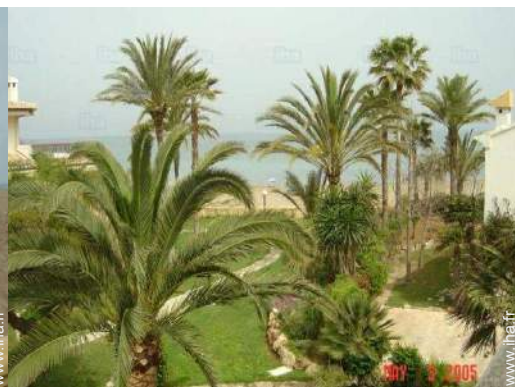
vue depuis la véranda