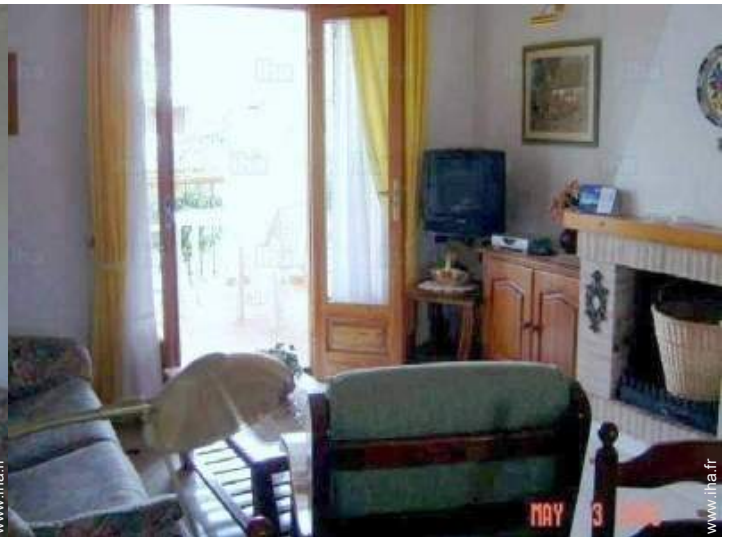
vue depuis le séjour