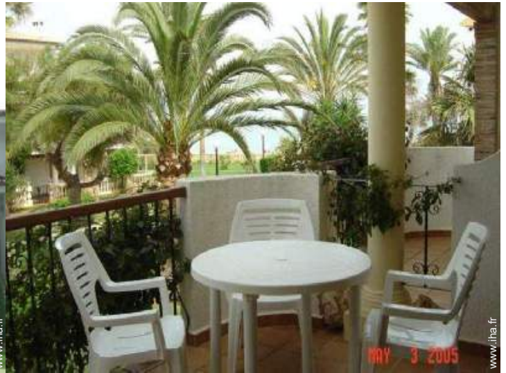
vue depuis le balcon