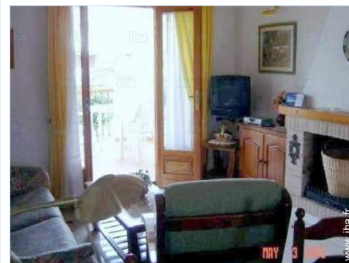
vue depuis le séjour

Centre village 15km Centre ville 5km Arrêt/station de bus 100m Location de voiture 4km Location de bateau 5km Traiteur 300m Petits commerces 500m Super marché 2km Poste 5km Banque 5km Distributeur automatique de billets 5km Pharmacie 500m Médecin 1km Hôpital 4km