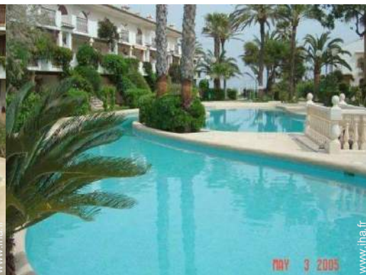
Installation extérieure à disposition des hôtes