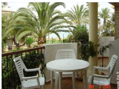
vue depuis le balcon