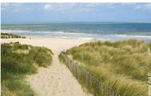
chemin de promenade