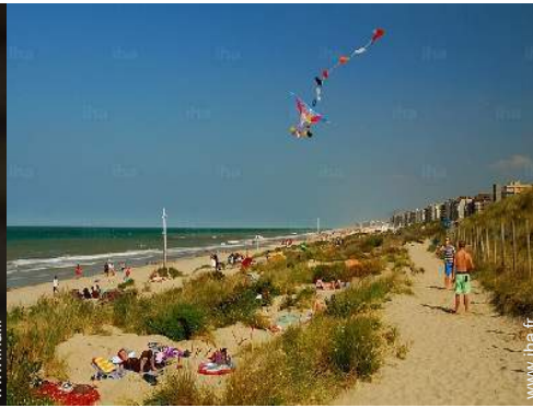
plage de sable