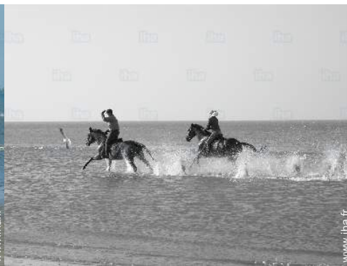
balade à cheval