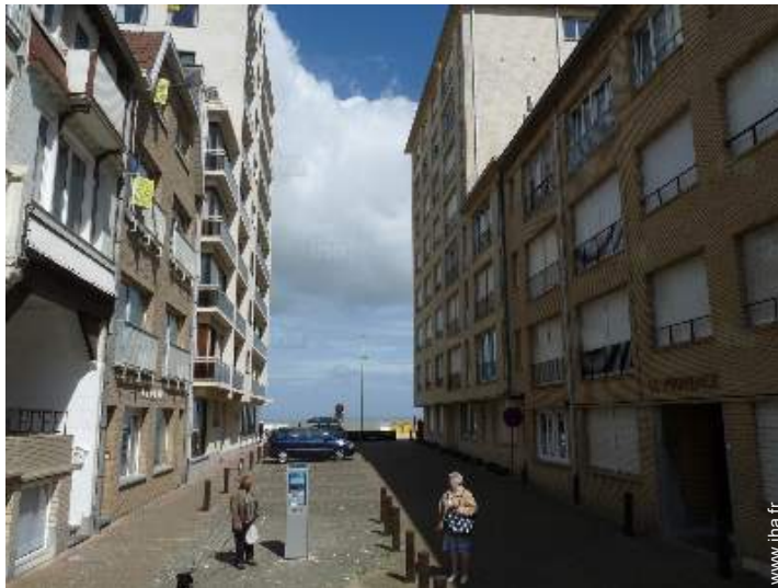
accès direct plage