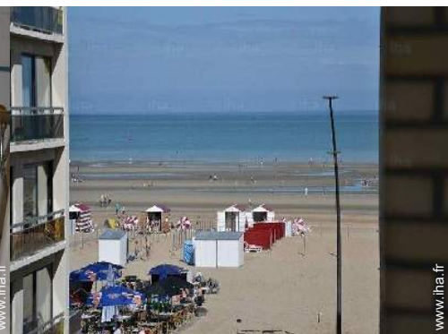
vue depuis l'appartement