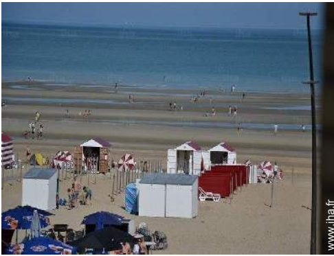
vue depuis l'appartement