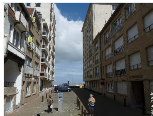
accès direct plage