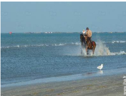
balade à cheval