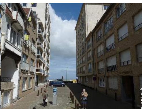
accès direct plage