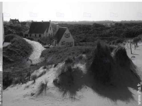
chemin de promenade