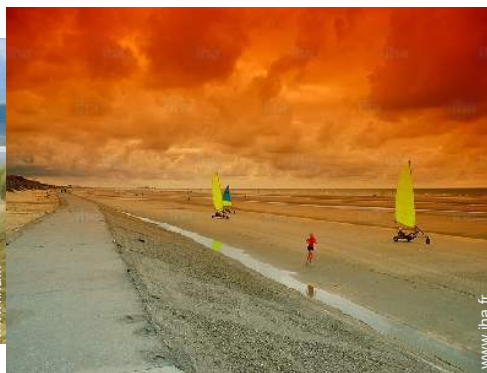
char à voile