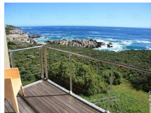
vue sur mer

Barbecue, table(s) de jardin, 12 chaise(s) de jardin, 5 chaise(s) longue(s), douche extérieure