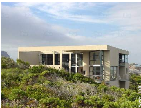
Propriété de Prestige