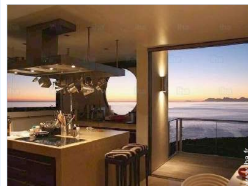
vue sur coucher de soleil