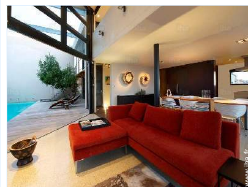
vue sur piscine