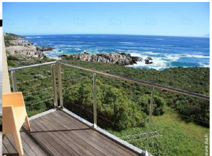
vue sur mer