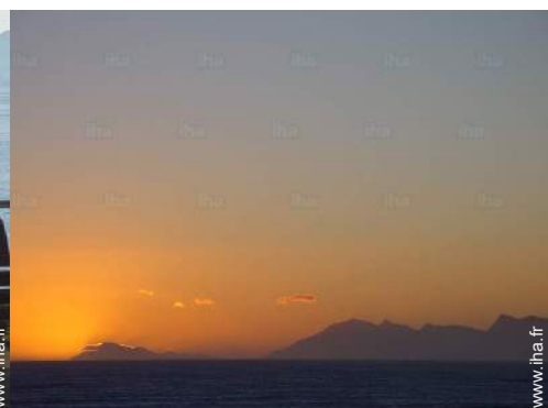
vue sur océan