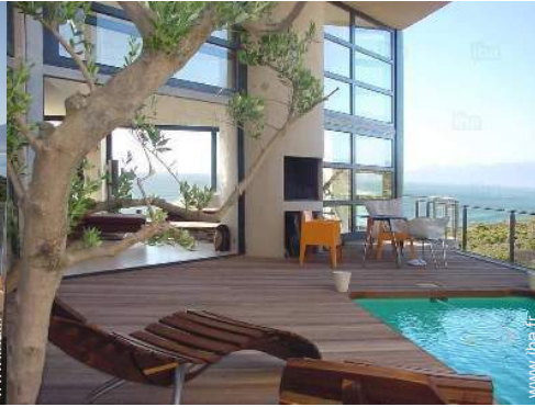
vue sur piscine