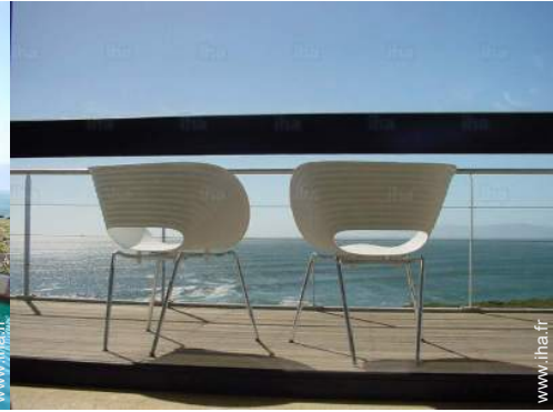
vue depuis le balcon