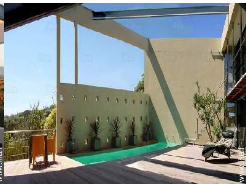
vue sur piscine