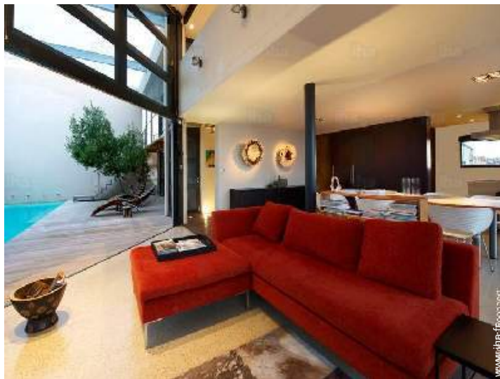
vue sur piscine