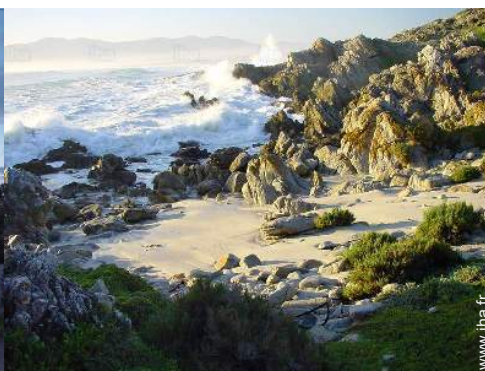
plage de rocher