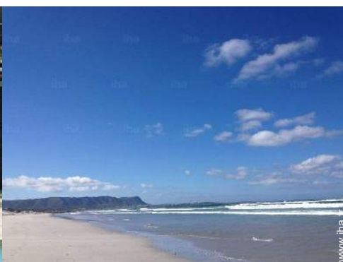
loisirs balnéaires à proximité