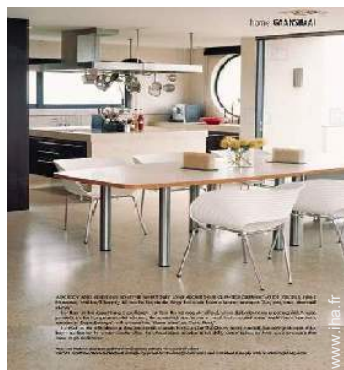
grande cuisine américaine