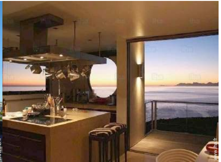
vue sur coucher de soleil