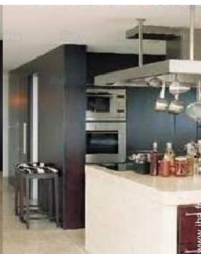
grande cuisine américaine