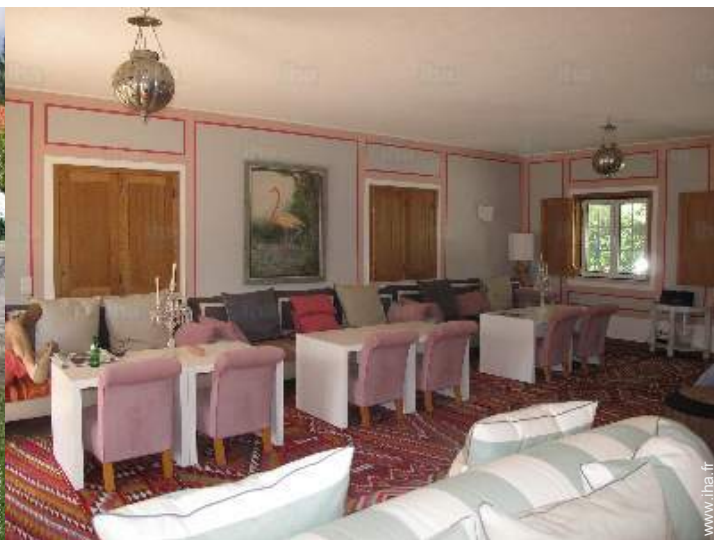
salle à manger