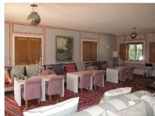
salle à manger